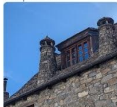
23-08-06 Anso y su desfiladero