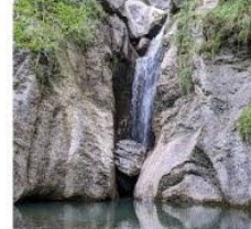
23-08-10 Cascada de Juan Pito