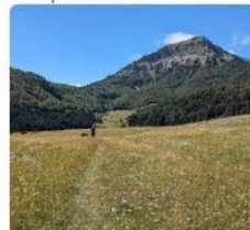
23-08-06 Hayedo de Gamueta