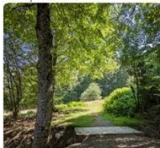
23-08-07 Mata de Haya