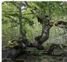
23-08-09 Paseo Refugio de Belagua