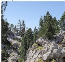
23-08-09 Pinar del Ferial Larra