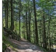
23-09-11 Irati por Zabaleta