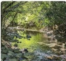
23-08-07 Pozas-Ermita-Puente Isaba