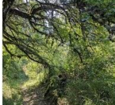
23-08-12 Paseo por Uztarroz