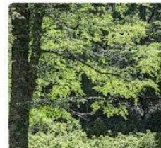
23-08-06 Cascada de Linza