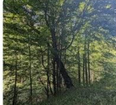
23-08-12 Hayedo de Uztarroz