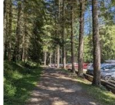
23-08-11 Irati Cascada del Cubo