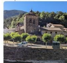
23-08-08 Paseo por Urzainki