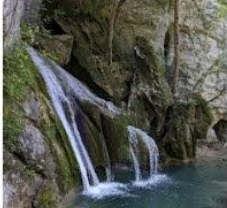
23-08-12 Cascada de Belabarze