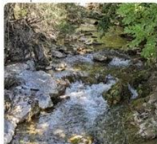
23-08-07 Cueva del Ibon Belagua