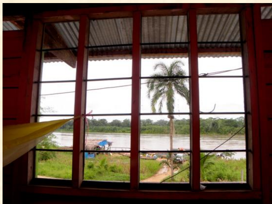
Vistas del río Madre de Dios desde el hotel