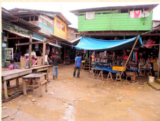
Las calles de Boca Colorado son puro lodazal

acercarme a Boca Colorado , lugar de donde salían numerosas embarcaciones, gracias a la intensa actividad para la extracción de oro. Después de tomar un colectivo hasta Santa Rosa, un taxi para acercarme al río Inambari, cruzarlo en lancha, y un todoterreno al otro lado, llegué al sitio, atravesando un tortuoso terreno selvático. La primera impresión que me dio Boca Colorado fue de un pueblo destartado sin apenas orden para alinear las casas de madera. Las calles irregulares, estaban encharcadas, sobre todo las más cercanas al río que, sometidas a sus crecidas, las barcas igual se posaban en barro como flotaban en agua. Se vivía un ambiente ambiguo difícil de describir que supuse se debía a su actividad aurífera. Hasta tenía un bonito barrio lleno de casas pintadas con colores llamativos al que entré haciendo lindas fotos y salí comprendiendo el porqué de la concentración de mujeres de generosa belleza.