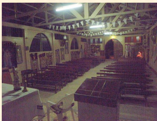
Al fondo derecha se encontraba el portal de Belén