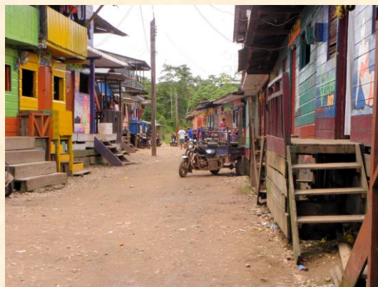
Calle de bellas mujeres de casas tan pintorescas

Elegí un hotel de madera cuyos ventanales daban al río para controlar fácil toda la movilidad fluvial hacia Boca Manu.