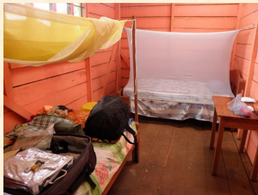
La mejor habitación del hotel. Un lujo

De las dos camas que tenía la habitación, una quedó inservible una noche de lluvia tropical. El modo de llover en la selva es total, como si quitaran la tapa del cielo y el agua callera toda de golpe, así que, por pequeño que fuera el resquicio en las juntas de madera, en la media hora que duró el aguacero, entró agua suficiente para empapar el colchón.